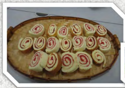
專屬自己的下午茶 ~